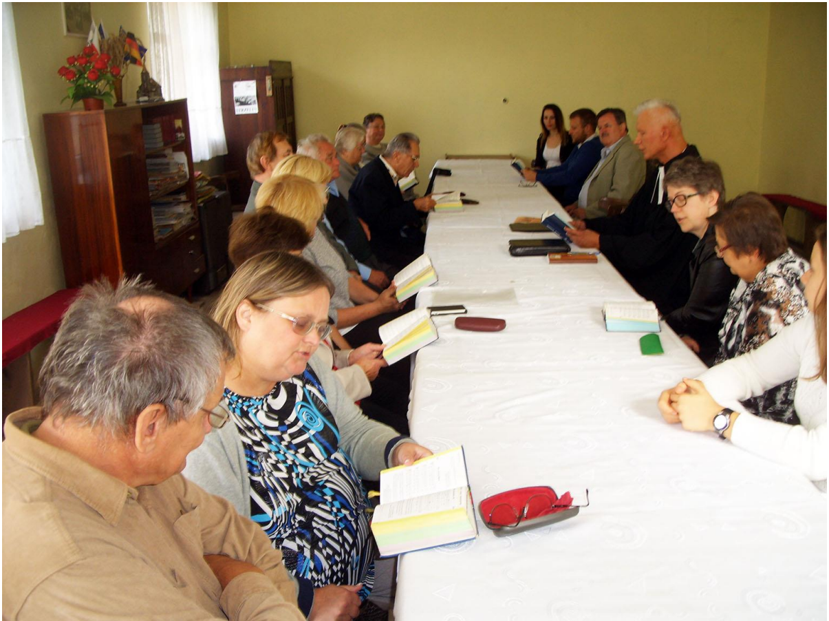
Gottesdienst am 1. Oktober 2016 im Hussinetzer Gemeinschaftshaus