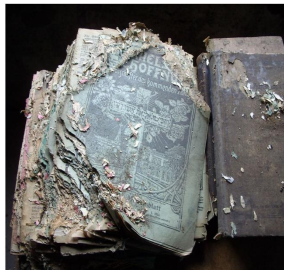
Mäusefraß und Vandalismus am Bücherbestand der Hussinetzer Gemeinschaft (Im Bestand befinden sich vor allem religiöse Schriften in deutscher und tschechischer Sprache sowie Schulbücher in polnischer und tschechischer Sprache)