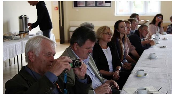
Spotkanie „Święto wielu kultur w Husinci - Hussinetz - Gęsińcu”